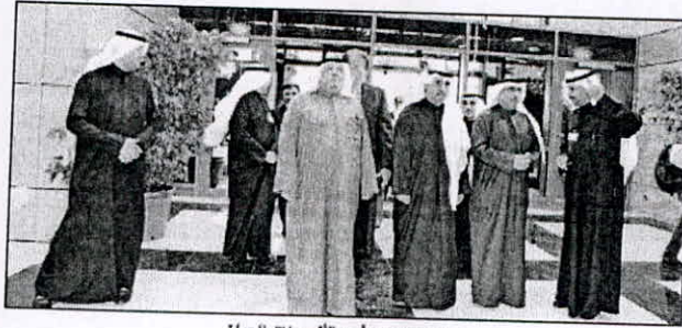
• محمد الفارس وأحمد الأثري خلال الجولة

شارك وزير التربية وزير التعليم العالي رئيس مجلس إدارة الهيئة العامة للتعليم التطبيقي والتدريب محمد الفارس برأه مدير عام الهيئة أحمد الأثري وعدد من المسؤولين يها في الاستلام الإبتدائي لمبنى الهيئة الجديد في منطقة الشويخ وذلك صباح أمس. وفي تصريح لوزير التربية أشاد بالمستوى المتميز والرالي للمنشآت التطبيقية الجديدة بمنطقة الشويخ مؤكداً أن مبنى الهيئة العامة للتعليم التطبيقي والتدريب الجديد يعتبر إضافة قوية ودافع كبير للتعليمي لتقديم خدمات تعليمية وأكاديمية مميزة ومتطورة. مضيفاً أن المنشآت الجديدة تبعث على الفخر. وأنها ستدفع الهيئة في مصاف الجامعات والهيئات التعليمية المتقدمة خاصة في توفير الخدمات المطلوبة. وأضاف أنه قد تم الإطلاع خلال