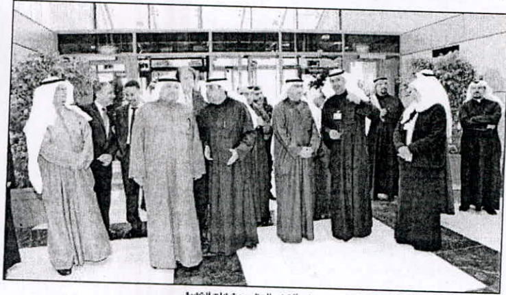
• وزير التعليم العالي مع قيادات التعليمي