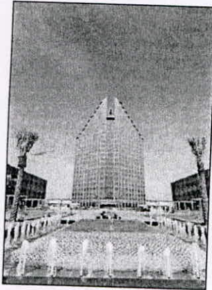
• مبنى الهيئة الجديد